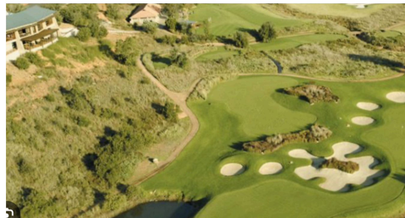
ELEMENTS PRIVATE GOLF RESERVE (2 jours)