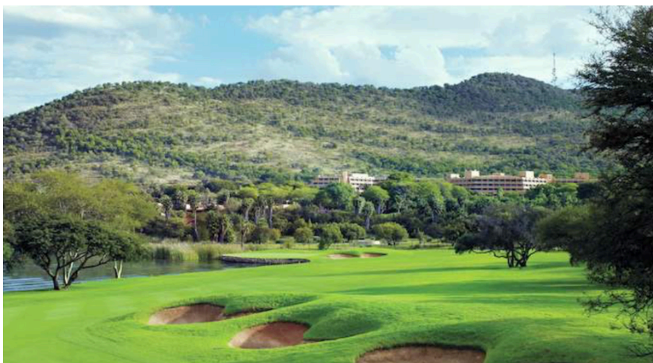
GARY PLAYER COUNTRY GOLF SUNCITY (1 jour)