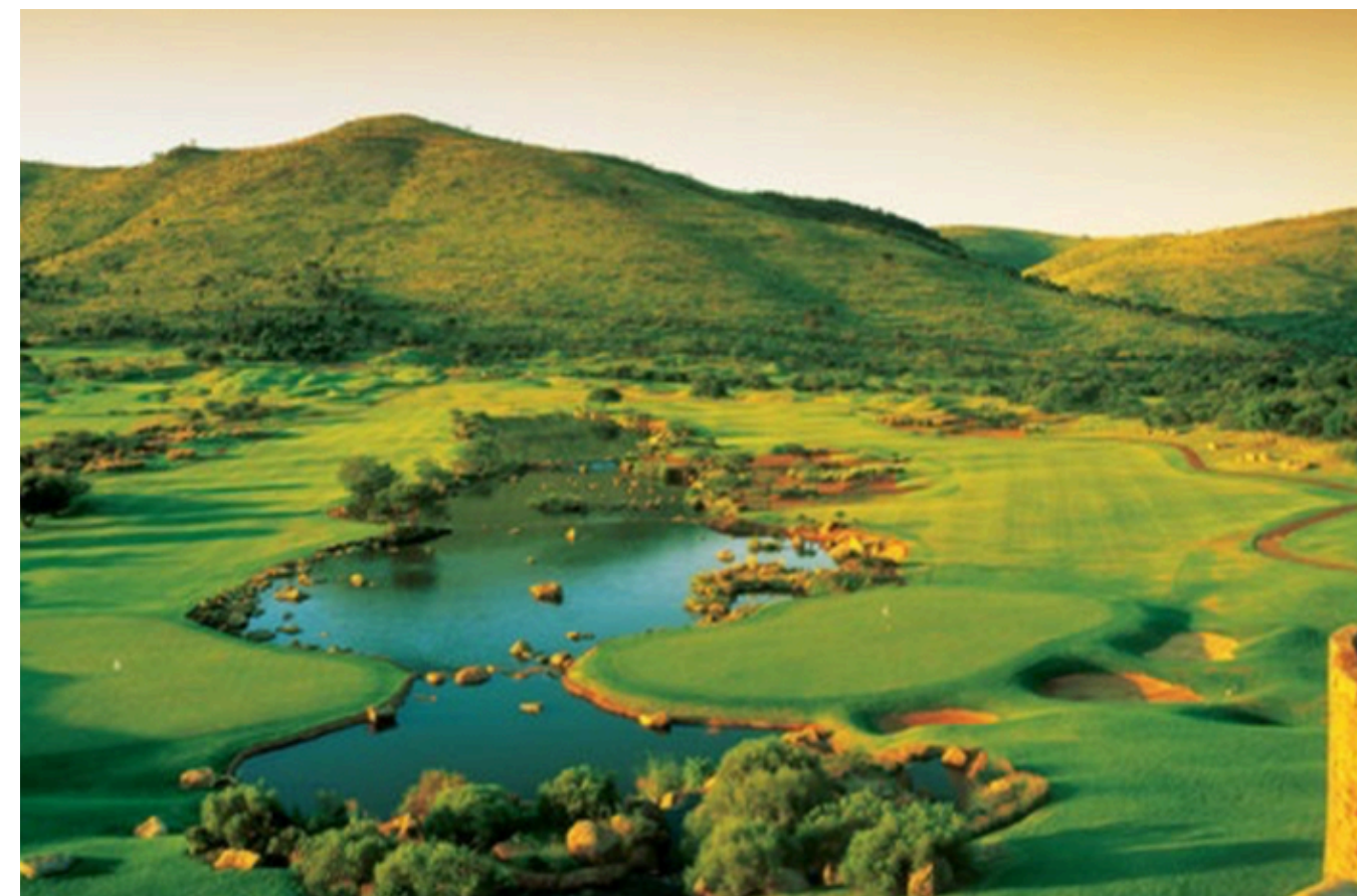
SUNCITY GOLF CLUB (1 jour)