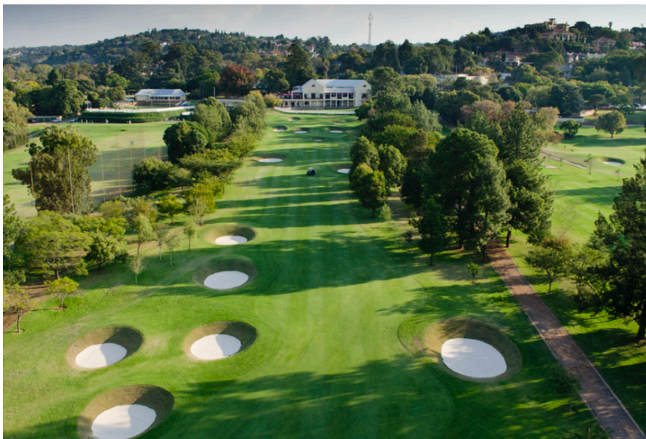
PRETORIA COUNTRY GOLF CLUB (1 jour)